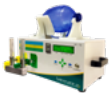
Suporte Respiratório Automatizado