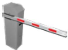
Soluções de estacionamento (Cancelas e Tags)