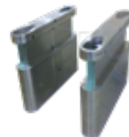
Bloqueios eletrônicos de alto padrão