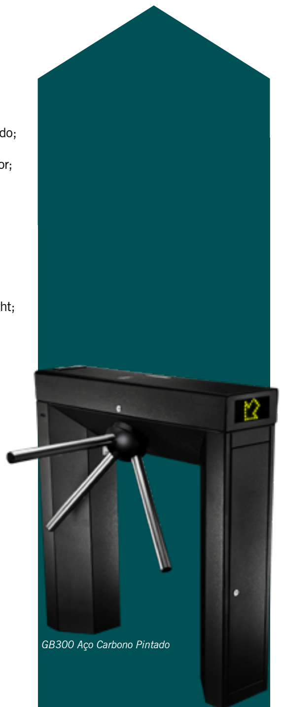
GB300 Aço Carbono Pintado

Obs: Os tipos de leitura deverão funcionar de forma conjugada ou isolada.