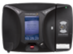
Registro Eletrônico de Ponto Portária 1510 - Homologado INMETRO